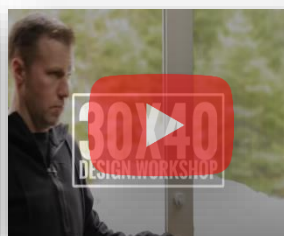
Cén fáth a n-úsáidtear samhltú i ndearadh.