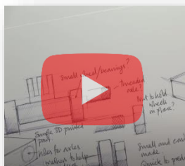
An tábhacht a bhaineann le nótaí a úsáid le linn sceitseáil deartha.

Cliceáil ar na tileanna íomhá thíos chun teacht ar naisc / físeáin úsáideacha.