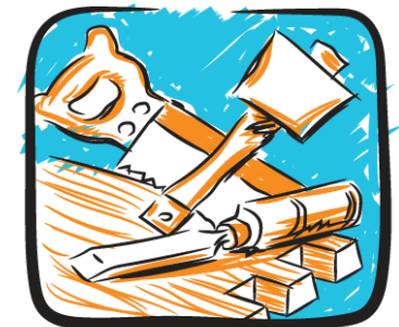
Teicneolaíocht an Adhmaid