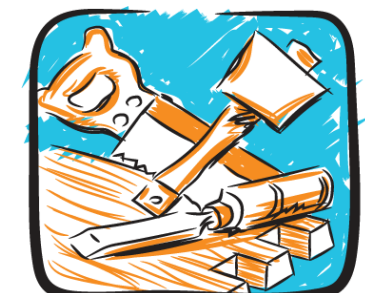
Teicneolaíocht an Adhmaid