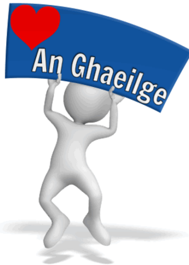
Scileanna Teanga | Úinéireacht | Taitneamh