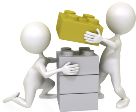
Cumarsáid agus Comhoibriú